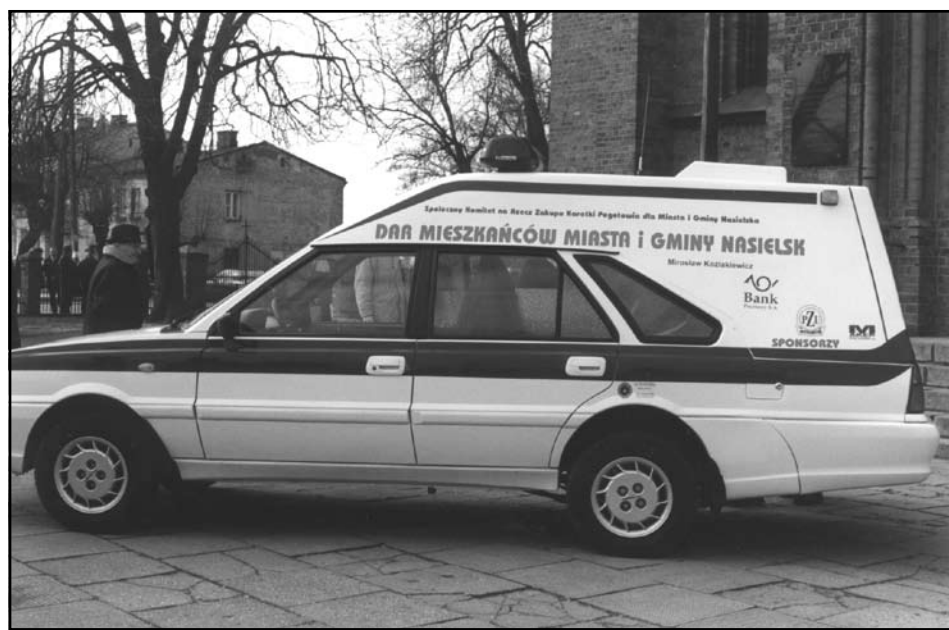
Tej karetki nikt nie chciał i nie chce zabrać!!!