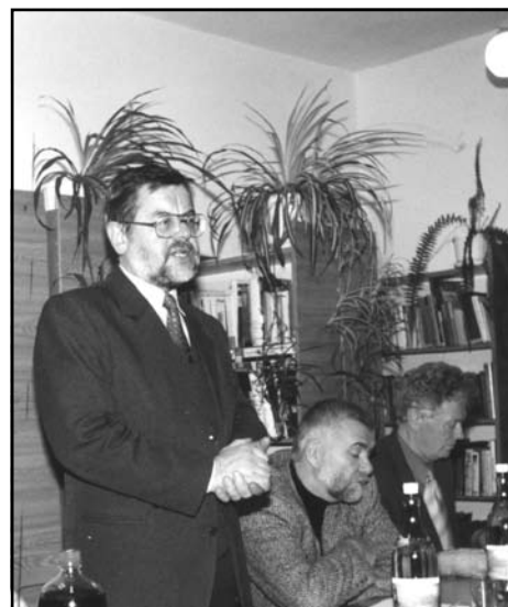
prof. Tomasz Nałęcz na spotkaniu w nasielskiej bibliotece

W ostatnich latach prof. Tomasz Nałęcz działalność naukową łączy z działalnością polityczną. Jest jedną z najważniejszych postaci w Unii Pracy.