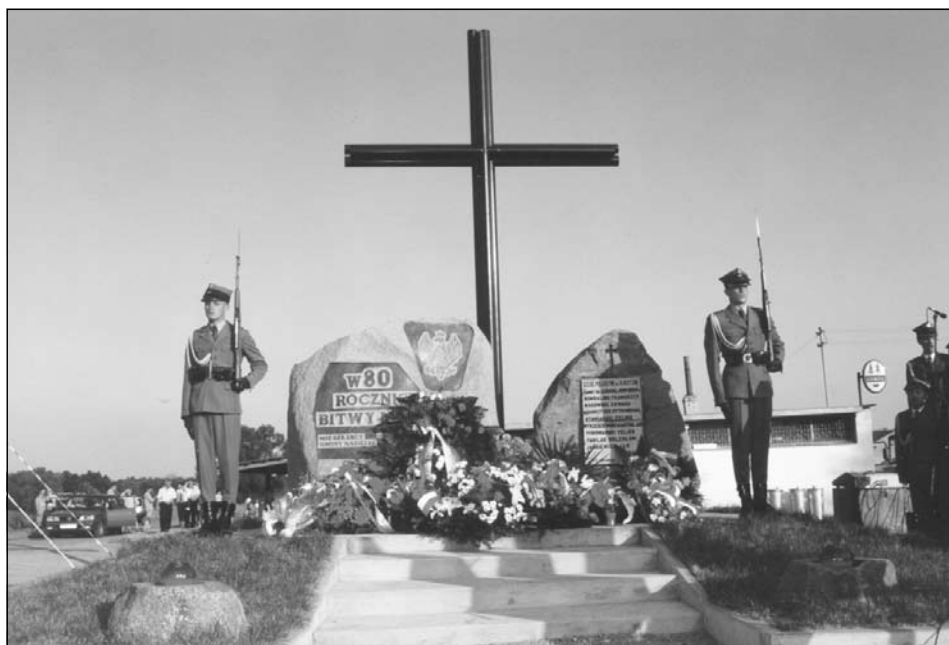
Warta honorowa przy pomniku w Borkowie

W trakcie uroczystości odprawiono wojskową Narodowej złożyła wieńce na pobliskich cmentar 1920r.