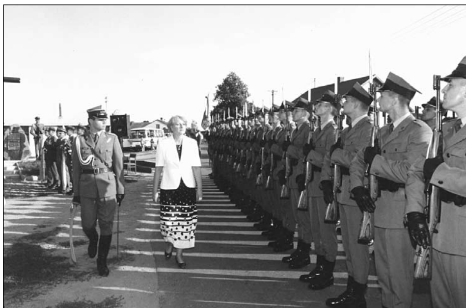
Minister obrony narodowej przed kompanią reprezentacyjną.