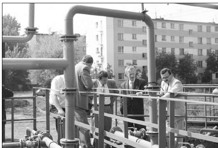
Zdjęcie archiwalne z otwarcia maleńkiej oczyszczalni na osiedlu Starzyńskiego

Obecna Rada podjęła również ten temat i poczyniła pewne kroki