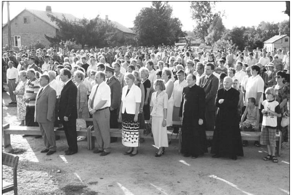
Uroczystość w Borkowie zgromadziła liczną grupę mieszkańców gminy Nasielsk