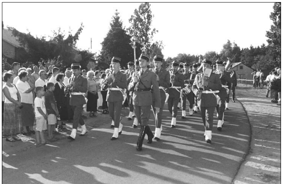
Orkiestra reprezentacyjna WP