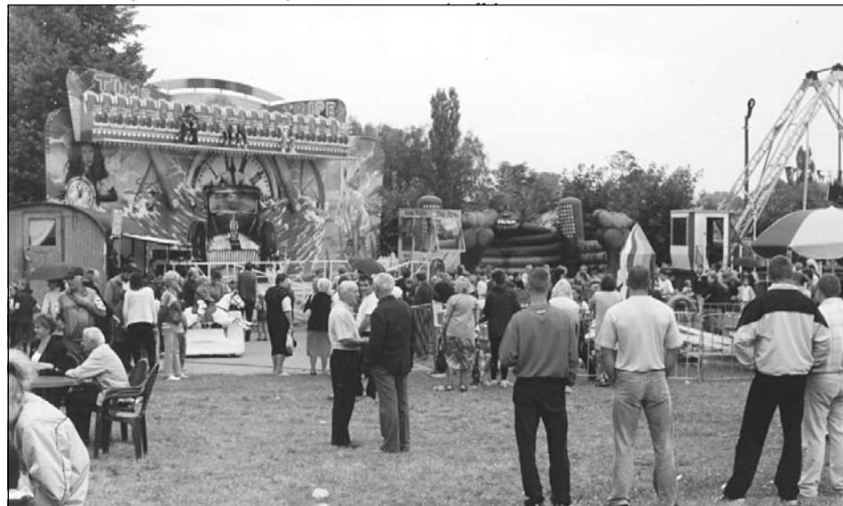
Festyn strażacki 1-2.09.2001r. w Nasielsku. Duże powodzenie miało wesołe miasteczko.