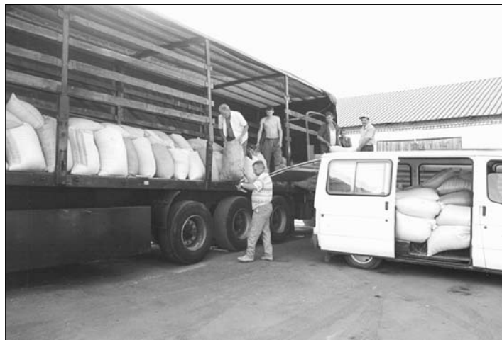
W sobotę do późnych godzin nocnych ładowano dary naszych rolników dla gminy Łągów