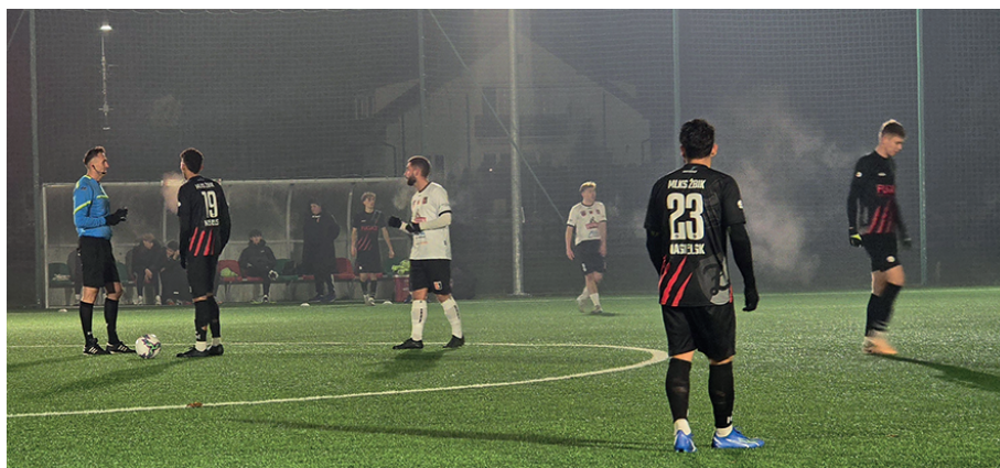
Decathlon V liga 2025/2026, grupa: mazowiecka I